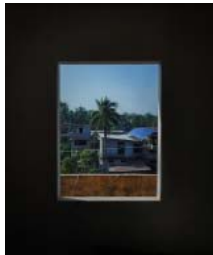
Caption : Frame in a Frame Parna Pratim Medhi, BA in MCJ (2nd Sem)