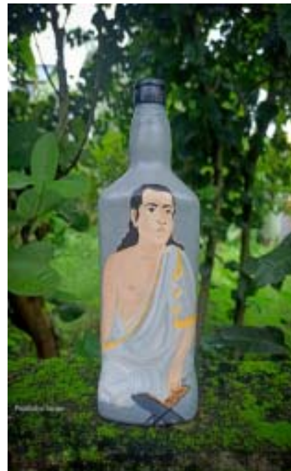
Pratikshya Sarma, BA in Education (2nd Sem.)